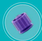
Tampa occlusora ENFit™ fêmea