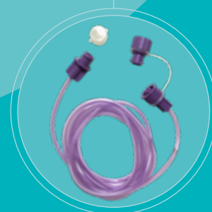
Extenset® Enteral e ENFit™