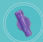
Conector ENFit™ fêmea