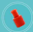
Tampa oclusora macho/fêmea